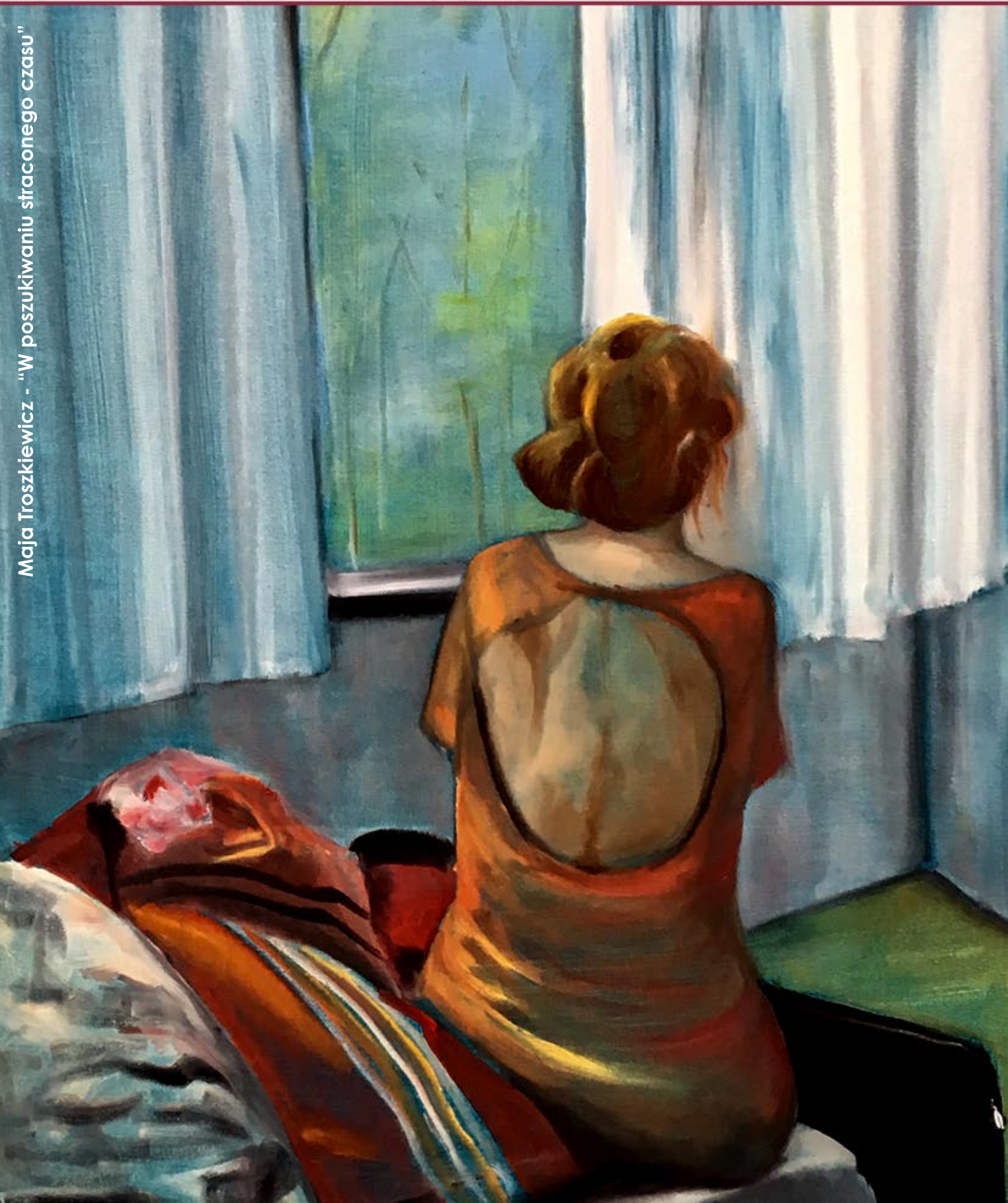
Maja Troszkiewicz - "W poszukiwaniu straconego czasu"